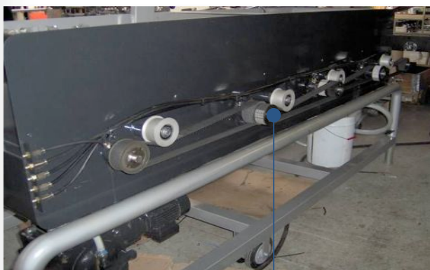
entraînement des rouleaux et des brosses par roues et courroies crantées